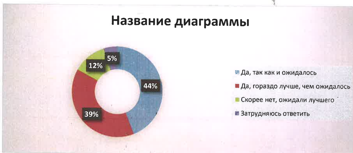
Рис.2 Уровень качества образования в колледже

Общая удовлетворённость студентов различными сторонами образовательного процесса находится на достаточно хорошем уровне. Большинство опрошенных студентов удовлетворены своей студенческой жизнью и считают, что колледж предлагает качественное образование.