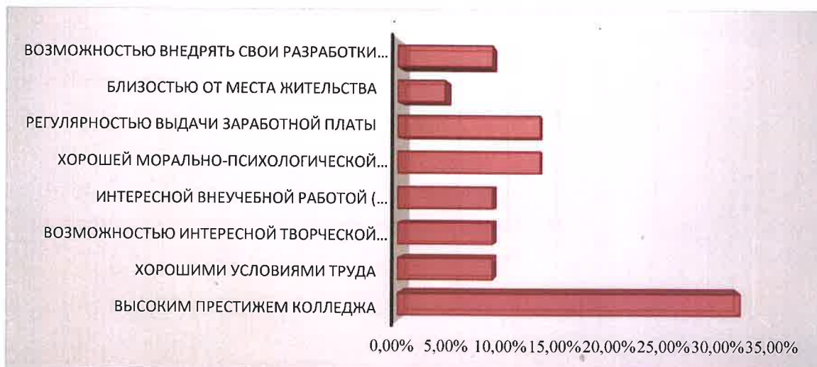
Рис.1 Уровень привлекательности работы в колледже

По данным опроса 90% студентов специальности 09.02.06 Сетевое и системное администрирование высоко оценили уровень качества образования, получаемого в колледже, и были полностью удовлетворены уровнем преподавания учебных дисциплин. Также все обучающиеся были удовлетворены доброжелательностью, вежливостью и тактичностью педагогов и сотрудников колледжа: